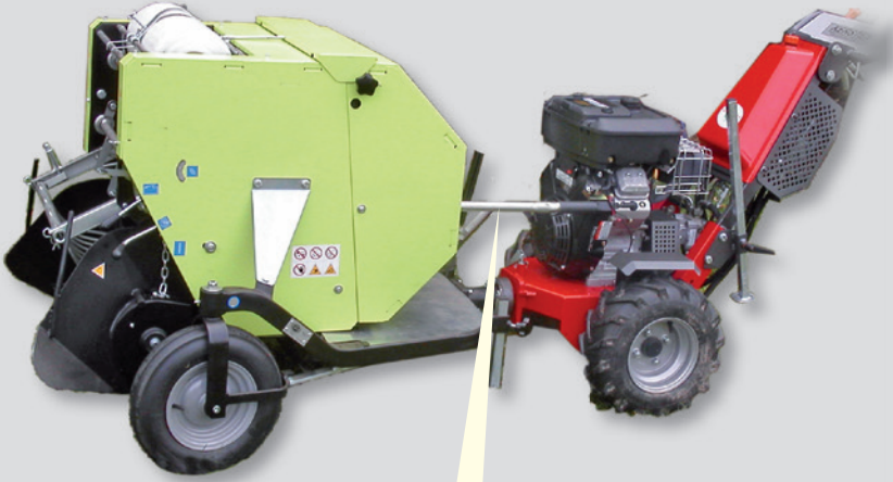
Hebel zum öffnen der Ballenkammer