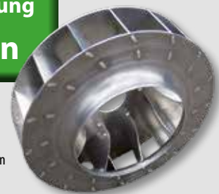
Optimiertes Lüfterrad für hohes Luftvolumen