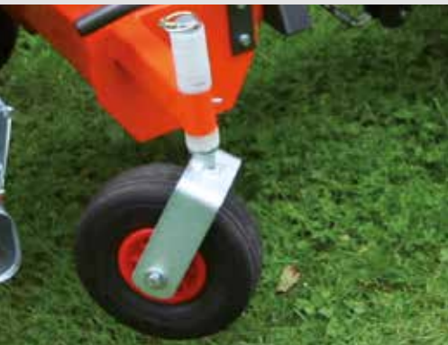
Laufräder zur Höhenanpassung