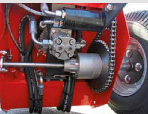
Hydrostatischer, stufenloser Fahrtrieb mit Differentialachse