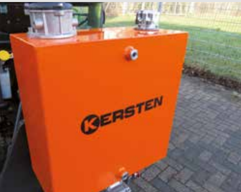
Hydrauliktank mit 50 Liter Öl