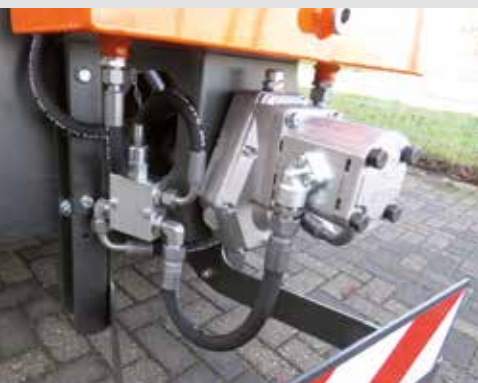
Hydraulikpumpe mit 30 Liter Förderleistung