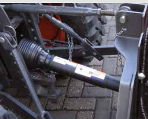
Für 540 rpm Zapfwellengeschwindigkeit Ausgelegt, auf Anfrage andere Geschwindigkeiten möglich