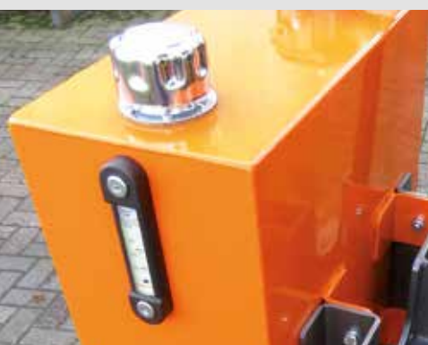
Ölnachfüllstutzen und Öltemperaturanzeige