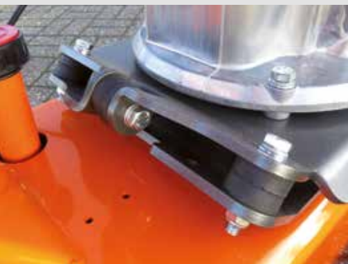
Vibrationsgedämpfter Motor für ermüdungsfreies Arbeiten. Hand-Arm-Vibration weniger als 2,5 m/s 2