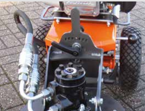
Winkelverstellung des Bürstentellers