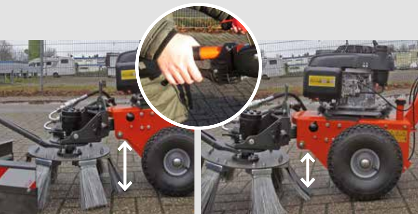
Stufenlose höhenverstellbare Achse, um Werkzeugverschleiß auszugleichen.